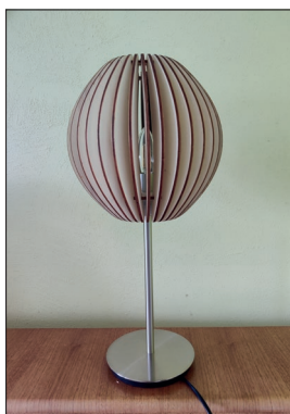
Stehlampe „Ellipse“ Fuß weiß oder schwarz