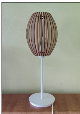
Stehlampe „Oval“ Fuß weiß oder schwarz